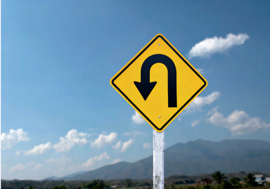
Traffic sign: Right U-turn sign on cement pole beside the rural road with white cloudy bluesky and mountains background, copy space.

Zeitenwende – ein Begriff, der seit dem russischen Angriff auf die Ukraine zum politischen Leitsignal geworden ist. Er steht längst nicht mehr nur für außen- und sicherheitspolitische Weichenstellungen auf Bundesebene, sondern für einen zunehmend erforderlichen Mentalitätswechsel. Auch auf kommunaler Ebene ist ein Umdenken gefragt. Denn die Herausforderungen reichen von Alltagskriminalität über Cyberattacken bis hin zu antisemitischen Vorfällen und Gewalt gegen Einsatzkräfte.