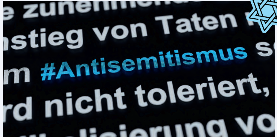
Bildnachweis: stock.adobe.com Antisemitismus (Antisemitism), „hashtag or posting on social media, texts or the breaking news. Incitement and violence against Jewish or non-Jewish von Westlight

Die liberale Demokratie lebt vom Vertrauen der Bürgerinnen und Bürger in die Schutzfunktion des Staates – nicht nur auf Bundes-ebene, sondern insbesondere dort, wo Menschen wohnen, arbeiten und ihre Kinder in die Kindertagesstätte oder Schule schicken: in den Kommunen. Das muss die zentrale Annahme der liberalen Leitidee in der kommunalen Sicherheitspolitik sein. Denn liberale Kommunalpolitik begreift Sicherheit nicht als Einschränkung, sondern als Voraussetzung für